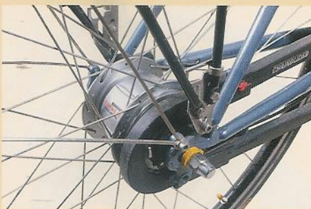
Läuft und läuft: Die Kombination aus komfortabler Shimano Nexus Premium-Nabe und geschlossenem Hebie Chainglider-Kettenkasten ist nahezu wartungsfrei.

+ VSF.all-ride Konzept funktioniert, keine Defekte, keine Lackschäden, einwandfreie Schalt- und Bremsfunktion, wenig Abnutzung der Verschleißteile, sehr gute Alltagstauglichkeit.